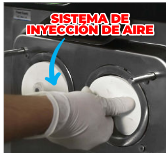
SISTEMA DE INYECCIÓN DE AIRE