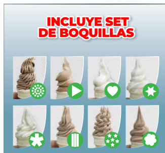
INCLUYE SET DE BOQUILLAS