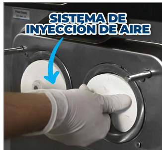
SISTEMA DE INYECCIÓN DE AIRE