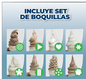
INCLUYE SET DE BOQUILLAS