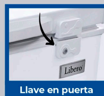
Llave en puerta