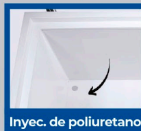
Inyec. de poliuretano